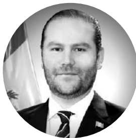
Álvaro ARZÚ (Vicepresidente) Guatemala